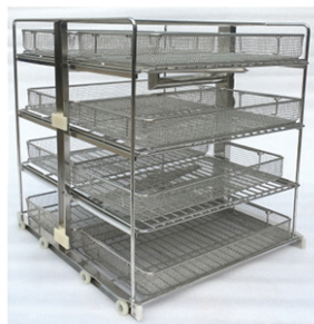
Support de nettoyage standard

Pré-nettoyage → avec des enzymes → Rincer → désinfection thermique → glaçage propre → séchage