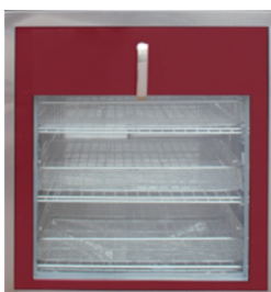
Porte en verre trempé